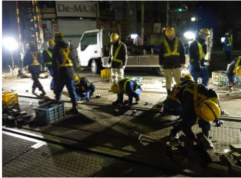
↑ 今回の作業員数は 約30人。

えいでんでは、定期的に 全線のレール点検を、少しの傷みも見逃すことのないよう、今後も 継続して 行っていきます。