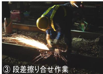
③ 段差擦り合せ作業