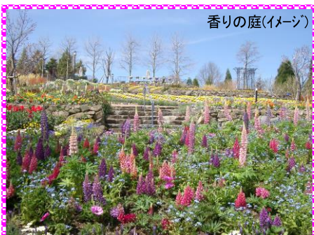
香りの庭(イメージ)