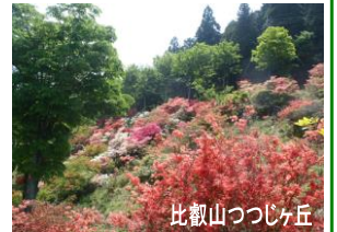
比叡山つつじヶ丘

☆当日の開催・中止のご確認は、TEL075-781-3305(当日午前6時以降)へ。