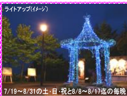
ライトアップ(イメージ)