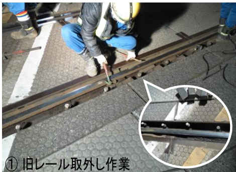
① 旧レール取外し作業