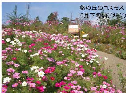
藤の丘のコスモス 10月下旬頃(イメージ)

花の足湯「フロリアル」 11月3、4、23、24、25日 は、 バラの足湯 に^^