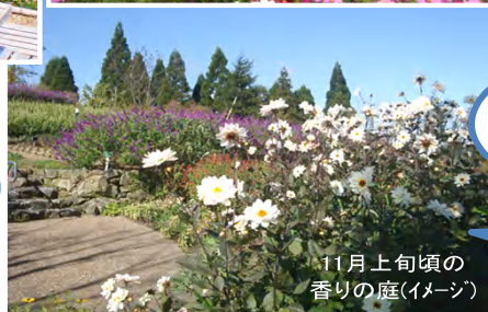
11月上旬頃の 香りの庭(イメージ)