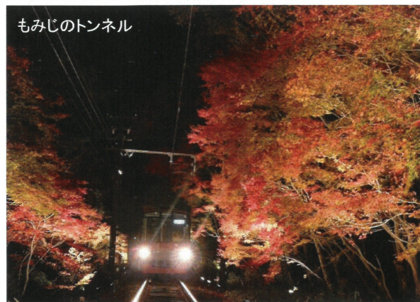
もみじのトンネル

で、ペア10組合計20名様にプレゼントいたします！ たくさんのご応募、お待ちしております。(乗車券は大人券のみとなります)