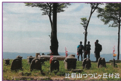
比叡山つつじヶ丘付近

《開催日》12月10日(日) 《受付》八瀬比叡山口駅集合 ※雨天・雪天およびコース不良の場合は中止