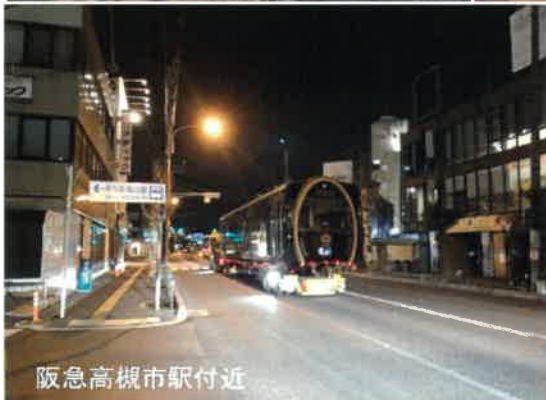
阪急高槻市駅付近