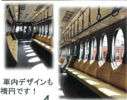
車内デザインも楕円です!