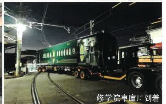
修学院車庫に到着