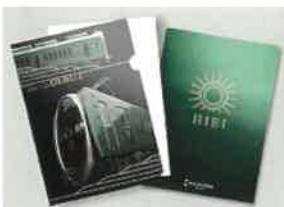
キラ鉄ファイル ¥400(税込)