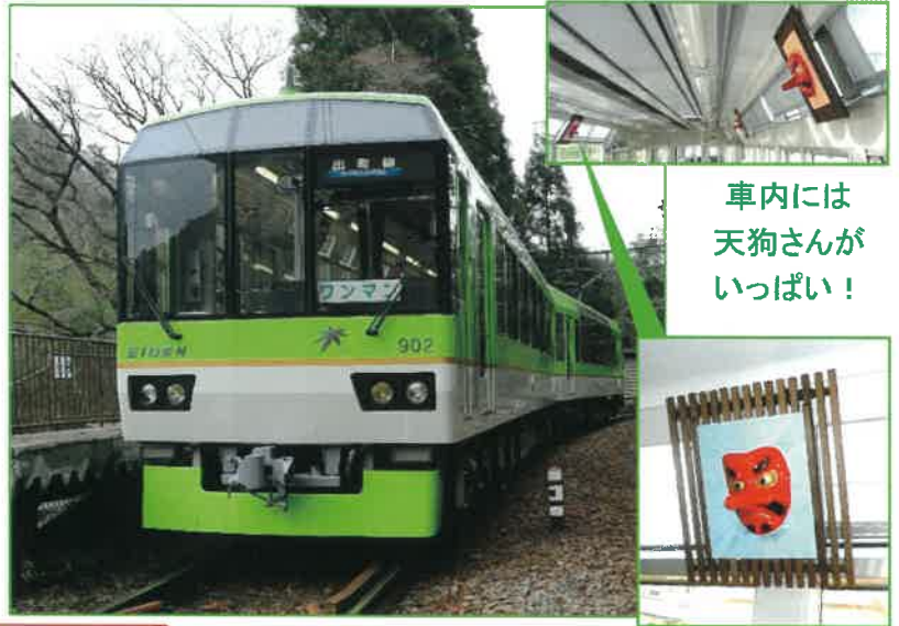
車内には天狗さんがいっぱい!

そして何よりもこのきららが真紅に染まる鞍馬線 市原駅~二ノ瀬駅間の「もみじのトンネル」をとおり季節が、今から待ち遠しいですね♪