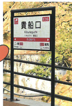
こころまち つくろう