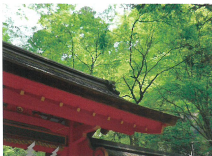
貴船神社 奥宮／貴船口駅下車

叡山電車1日乗車券「ええきっぷ」をペア10組20名様にプレゼントします！鮮やかな新緑のえいでん沿線をお楽しみください。今回ご紹介した“貴船口駅”へもぜひお越しくださいね(^_^) ☆たくさんのご応募お待ちしております。 ・乗車券は大人券のみとなります