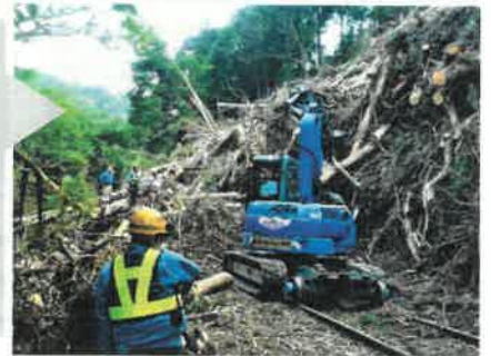
土砂崩れの箇所以外にも、倒木でふさがれてしまった軌道が複数ありました。

新型コロナウイルス感染拡大防止に加え復旧作業のため今年の「えいでんまつり」は中止とさせていただきます。