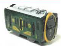
カプセルプラレール特別番外編