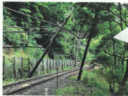
大雨により、電線や電柱等電気設備への被害も多発しました。