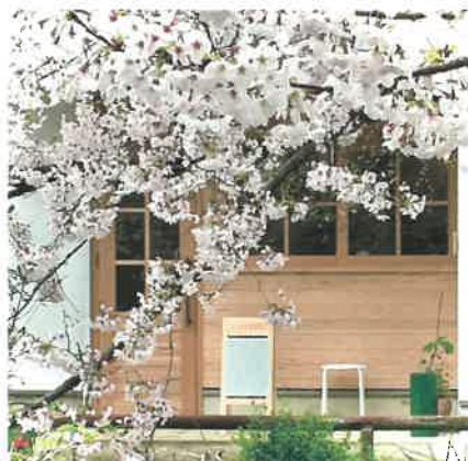
お店の前には疎水が流れお散歩に最適

にはそれぞれに焙煎度や味がわかりやすくネーミングされています。便利なドリップパックもありますよ(^_^)