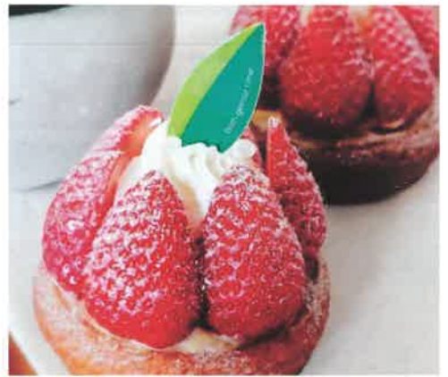
京都産フルーツのパウム・タルト(苺)は5/7までの限定品

元田中駅から茶山駅に向かうえいでんの車窓から見える青いテントの洋菓子店「茶山 sweets Halle」は茶山駅から南へ徒歩1分。京都府産素材を使った洋菓子はすべて店舗内の工房で手作りされています。京都産の素材を使ったマドレーヌやプリンはとても濃厚(*^-^*) 名物のバウムクーヘン、期間限定のフルーツタルトもぜひ♪