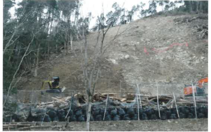
3月時点の現場。石や土砂を取り除いている。

2020年7月に発生した鞍馬線貴船口駅付近における土砂崩れの影響により、現在も市原駅から鞍馬駅間で、運転を休止しております。このたび、治山事業を実施する京都府と鉄道施設の復旧に当たる当社との間で検討の結果、 今年の秋までを目途に運転を再開する見通し となりました。長期にわたりご不便、ご迷惑をおかけしておりますことを、心よりお詫び申し上げます。