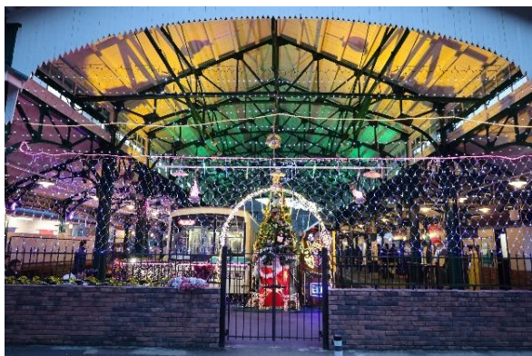
昨年のように ※叡山電鉄のみで装飾