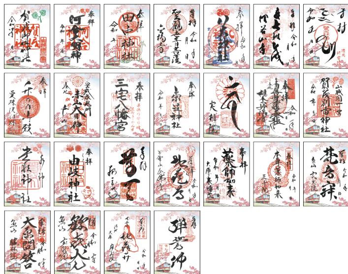
《春の特別ご朱印イメージ》