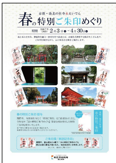
《春の特別ご朱印めぐり》