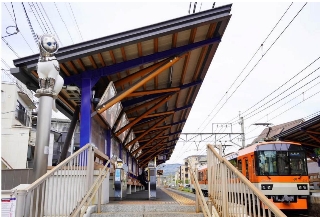
現在の「茶山・京都芸術大学駅」の様子。手前にヤノベケンジ氏の《SHIP'S CAT (TOWER)》

周辺地域は、若手アーティストのスタジオやアトリエが点在するエリアでもあります。「守護」のシンボルであり、人々に勇気を与える存在ともいわれる「風見鶏」をモチーフとした街灯作品が、地域を明るく照らしながら、学生やものづくりに携わるすべての人々の創作活動を見守ります。なお、現代美術家ヤノベケンジ氏の作品《SHIP'S CAT (TOWER)》は継続展示します。