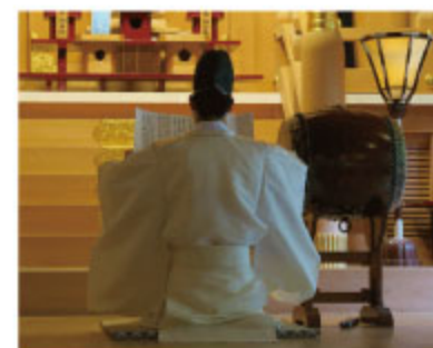
昨年も貴船神社へ奉納 させていただきました。