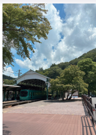
八瀬比叡山口駅「駅テラス」

星空案内人と一緒に、天体望遠鏡や 電視望遠鏡、双眼鏡を使って星空を 観望してみよう。