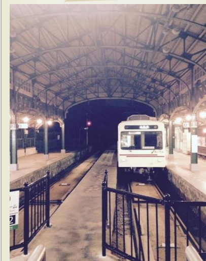
夜の八瀬比叡山口駅にて