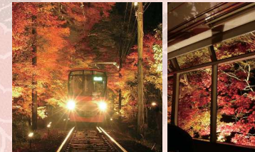
アクセス 市原〜二ノ瀬間・貴船口駅・貴船周辺

11月中旬頃 貴船周辺 秋の夜空を彩る紅葉のライトアップは、叡山電車、貴船神社、貴船街道で行われ、3つの趣きをもったライトアップが楽しめます。