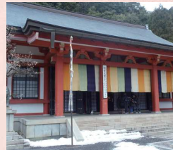
アクセス 『鞍馬』駅下車、仁王門まで徒歩約3分

1月最初の寅の日 鞍馬寺 毘沙門天が鞍馬山に寅の月、寅の日・寅の刻に現れた事に因む行事。寅の日に毘沙門天に参拝すると無量の大福を授かると言われる。