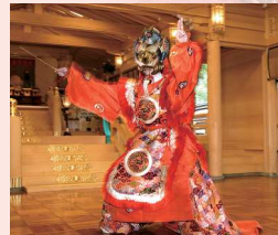
アクセス 『貴船口』駅下車、京都バスのりかえ「貴船」へ

7月7日 貴船神社 (土・日の場合は翌月曜日) 古来の雨乞い神事に由来し、水の恵みに感謝する祭典。献茶式、式庖丁、舞楽などが奉納される。