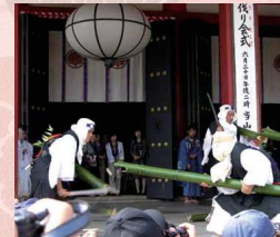
アクセス 『鞍馬』駅下車、仁王門まで徒歩約3分

6月20日 鞍馬寺 京都でも有数の古い祭事。大蛇になぞらえた青竹を伐る速さを競いあい、1年間の豊凶を占う行事。