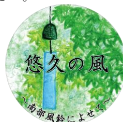
ヘッドマークデザイン