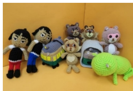
手作り編みぐるみ展示イメージ