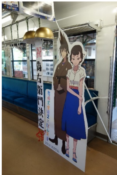
スタンディ展示のイメージ（当日は屋外での展示です）