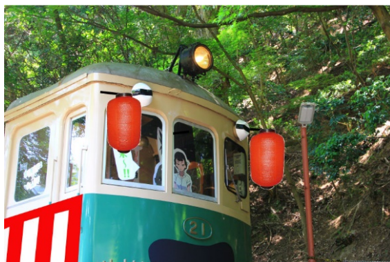
納涼船仕様に変身をしたデナ21形のイメージ

鞍馬駅に保存されている「デナ21形」が、2017年5月4日(木・祝)より「偽叡山電車」に変身しておりますが、当日はアニメに登場する「偽叡山電車納涼船仕様」を再現します。