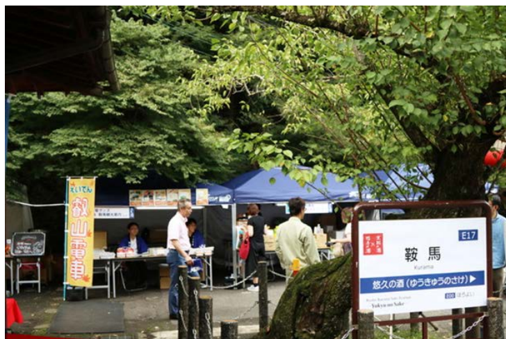
販売ブースイメージ