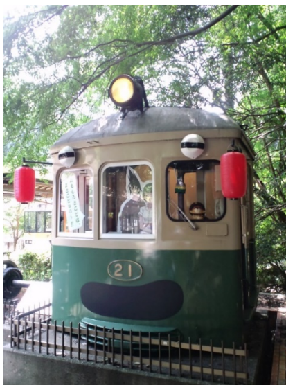
デナ21形「偽叡山電車 納涼船仕様」イメージ