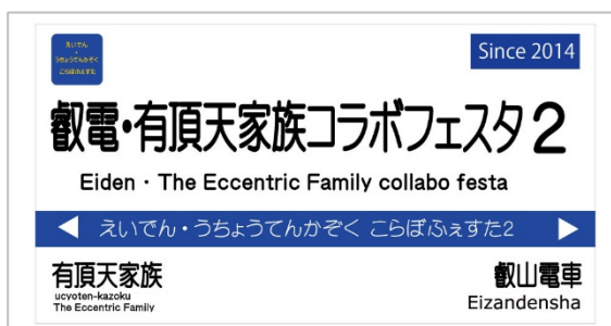
コラボ駅名標のイメージ