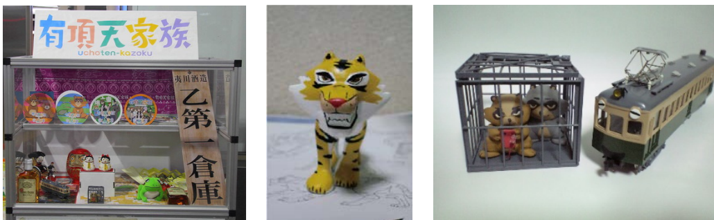
コラボアイテムのイメージ

※出町柳駅に展示中のコラボアイテムは、2月24日(土)～25日(日)のみ展示を中止します。