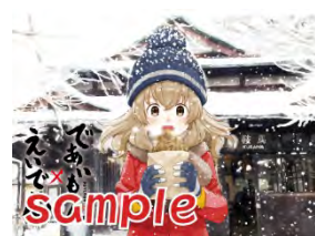
沿線の四季をモチーフにした車内(ドア)ラッピングのイメージ