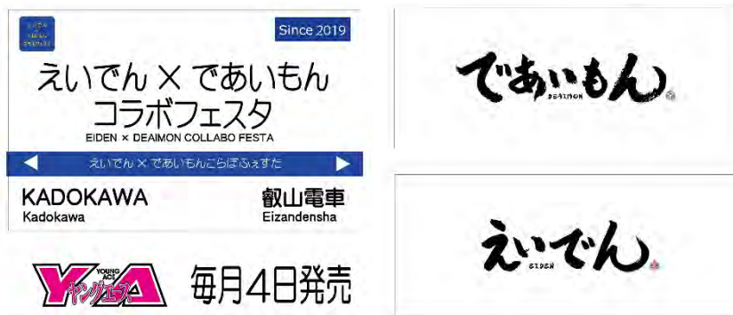
コラボ駅名標、コラボ方向幕イメージ