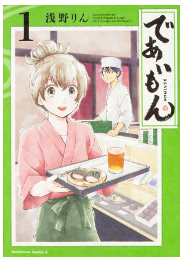
『であいもん』①巻書影