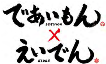
コラボロゴのイメージ