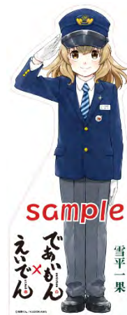
スタンディPOPのイメージ