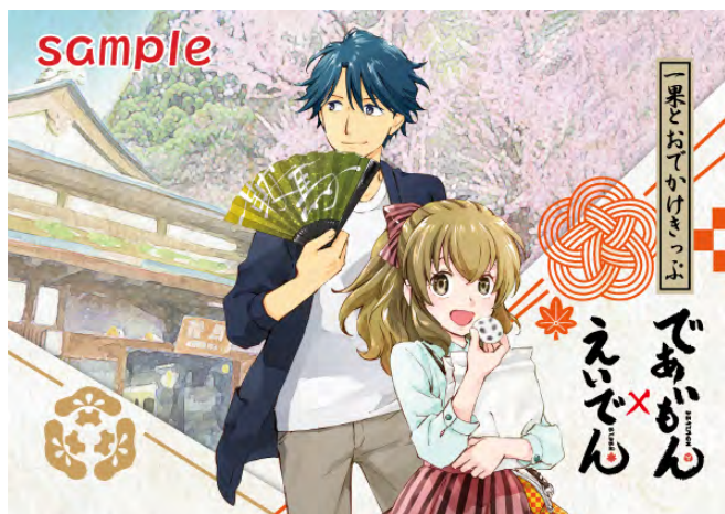
コラボきっぷ特典台紙のイメージ