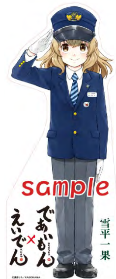
スタンディPOPのイメージ