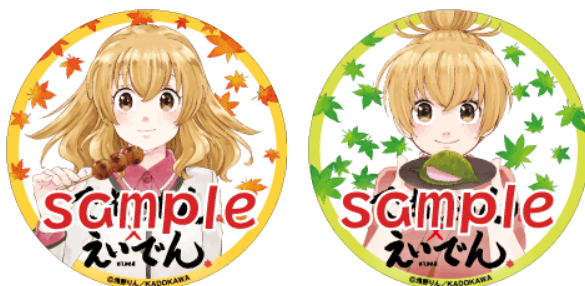
ヘッドマークのイメージ