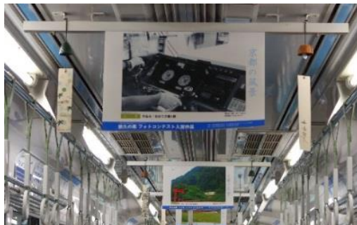
車内（展示イメージ）

※三陸鉄道久慈駅（岩手県久慈市）でも「第6回悠久の風フォトコンテスト」入選作品を展示します。