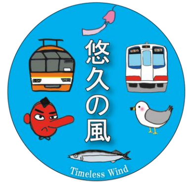
ヘッドマークデザイン