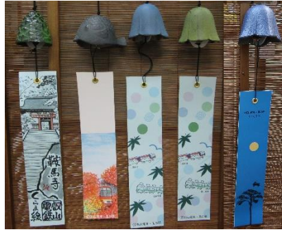
南部風鈴（イメージ）