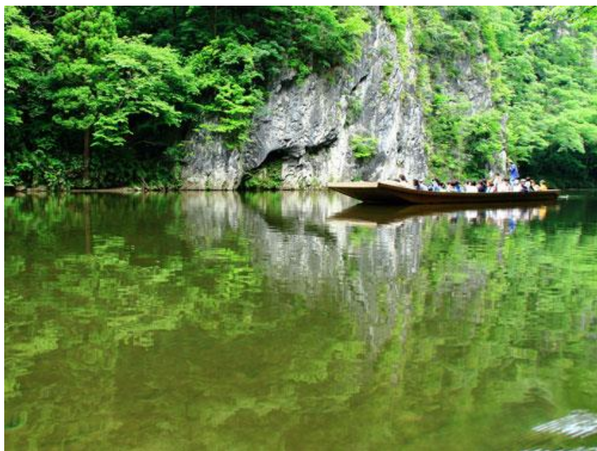
第6回悠久の風フォトコンテスト大賞作品「 げいびけい 狷鼻溪をたゆたう」