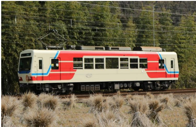
三陸鉄道カラー車両