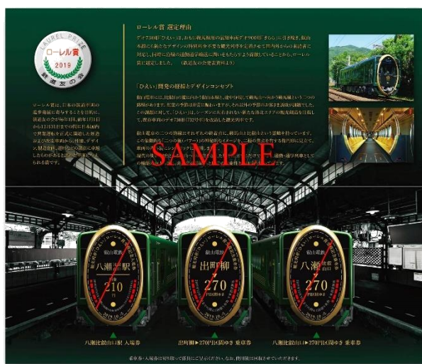
観光列車「ひえい」ローレル賞受賞記念きっぷ中面のイメージ