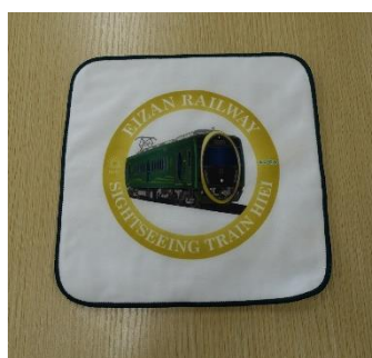
ソフトライナータオル