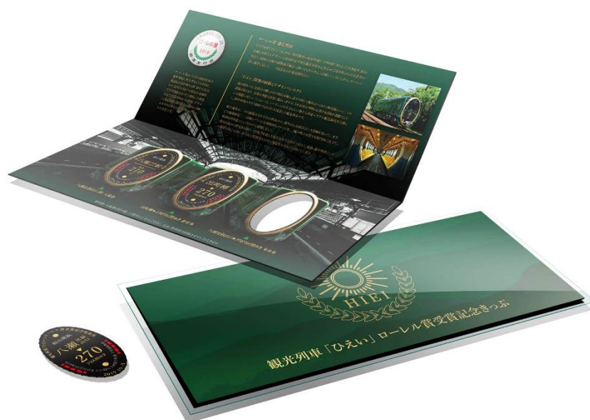
観光列車「ひえい」ローレル賞受賞記念きっぷのイメージ

叡山電車ホームページ「ひえい」特設サイト https://eizandensha.co.jp/hiei/