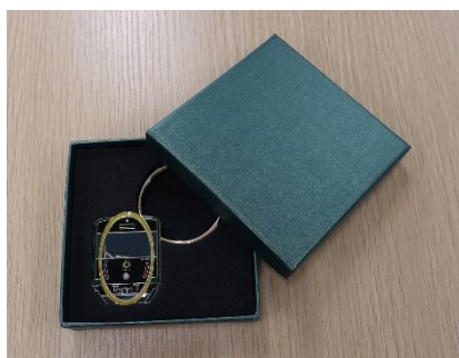
ダイカットメタルキーホルダー