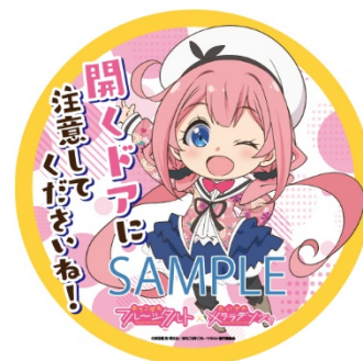
ドア注意喚起ステッカーのイメージ