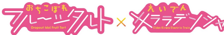
コラボロゴのイメージ

全ての企画には、「おちこぼれフルーツタルト×えいでんキララデンシャ」コラボロゴを使用します。