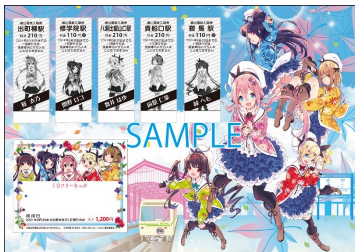
コラボきっぷのイメージ