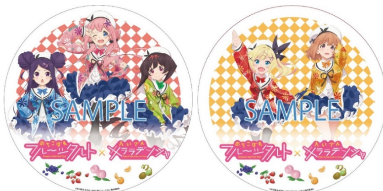
ヘッドマークのイメージ