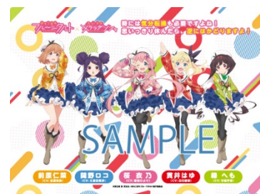
車内ラッピングのイメージ