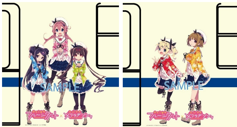
車体ラッピングのイメージ