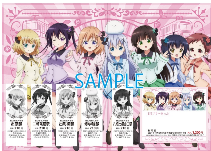
コラボきっぷのイメージ