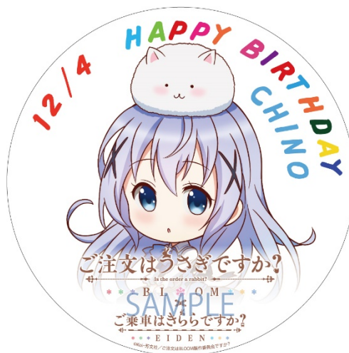
誕生日ヘッドマークのイメージ