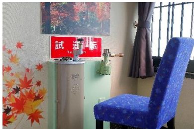
「きらら」仕様の椅子