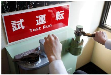
マスクン・ブレーキ