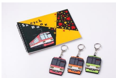
「きらら」ラバーキーホルダー 「マルマン×きらら」スケッチブック