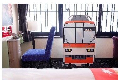
記念撮影用パネル