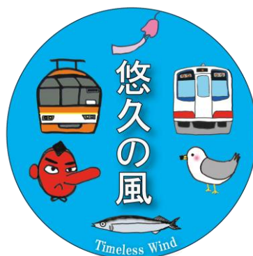
ヘッドマークデザイン