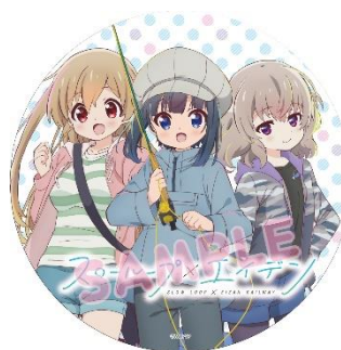
コラボヘッドマーク、ラッピングのイメージ