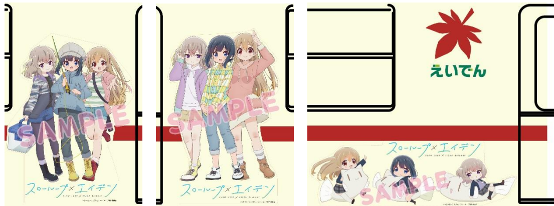
車体ラッピングのイメージ