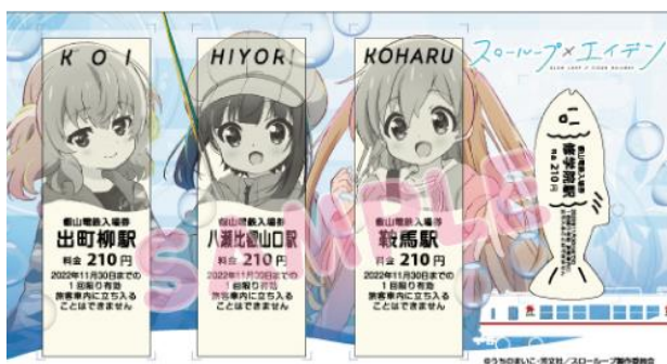
コラボきっぷのイメージ