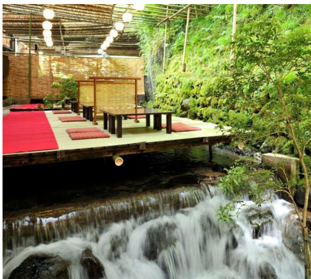
「貴船の川床」イメージ