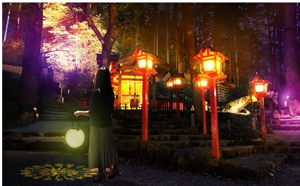
貴船神社結社のイメージ