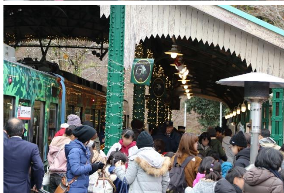
過去の開催時のようす