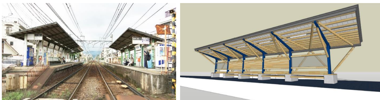
【美装化後のイメージ】(左：現状 → 右：美装化後)