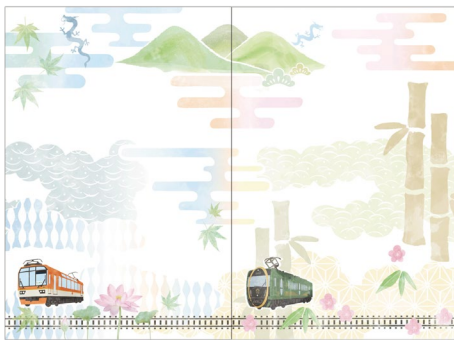
〔第二節〕特別台紙 〔第一節〕特別台紙