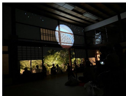
前回の「雪の庭プラネタリウム」