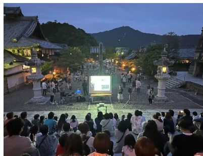
前回の「星のお話し」の様子