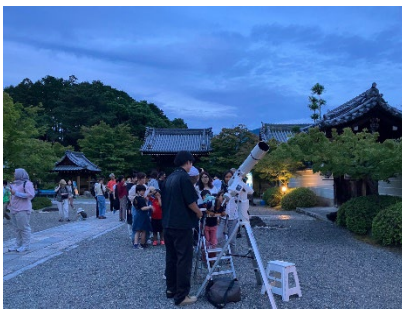
前回の「星空観望」の様子