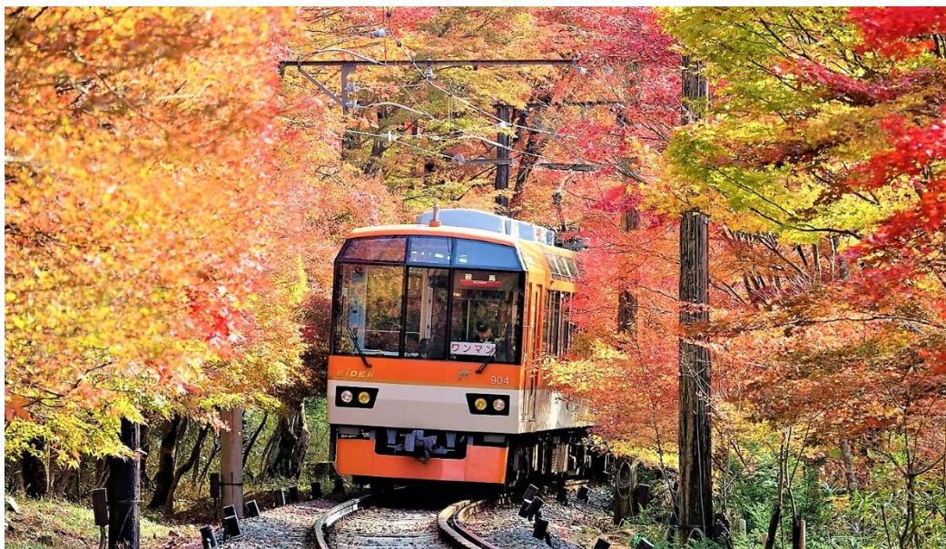
「もみじのトンネル」を走行する展望列車「きらら」