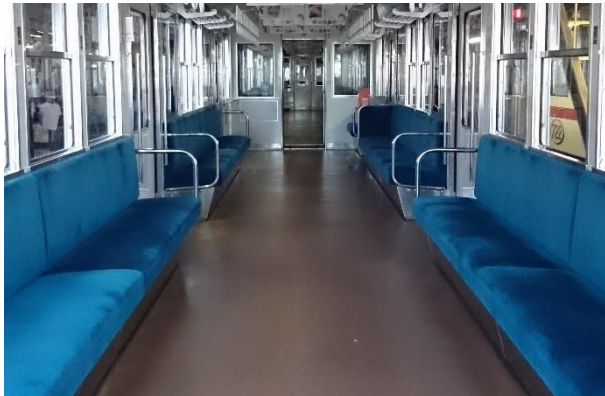
ロングシート車（800系）車内