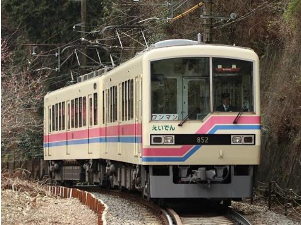
ロングシート車（800系）外観