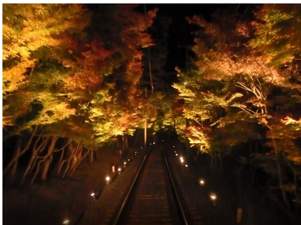
もみじのトンネル車窓