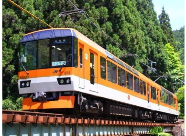
展望列車「きらら」(900系) 外観