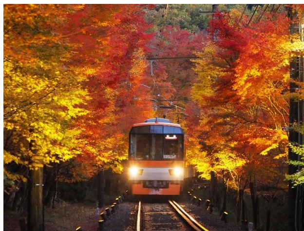
もみじのトンネル