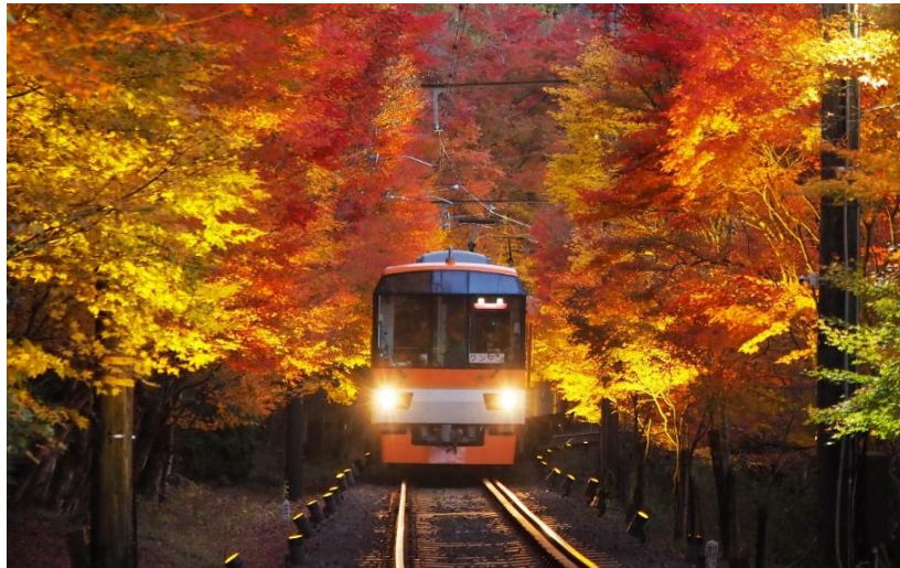
「もみじのトンネル」を走行する展望列車「きらら」