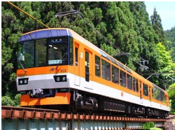
展望列車「きらら」(900系) 外観