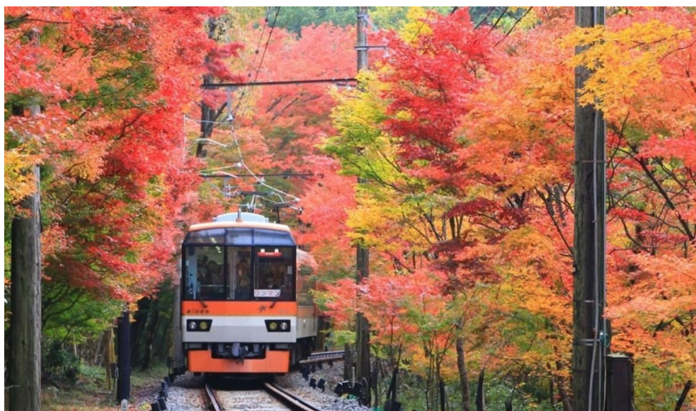
「もみじのトンネル」を走行する展望列車「きらら」