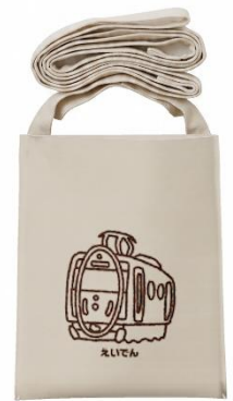
サコッシュのイメージ