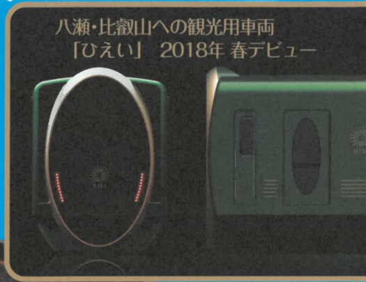
八瀬・比叡山への観光用車両 「ひえい」 2018年春デビュー