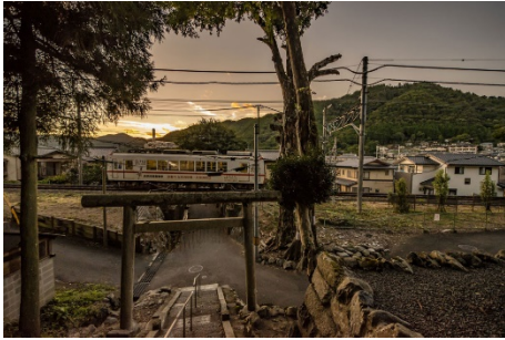
作品名 / 夕暮列車 撮影場所 / 左京区静市市原町 カメラ / Nikon D5500