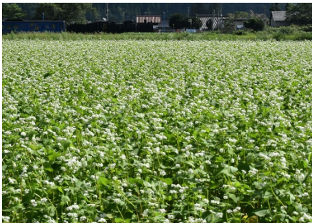
作品名 / そば畑の中を 撮影場所 / 岩手県遠野市 カメラ / Nikon D500