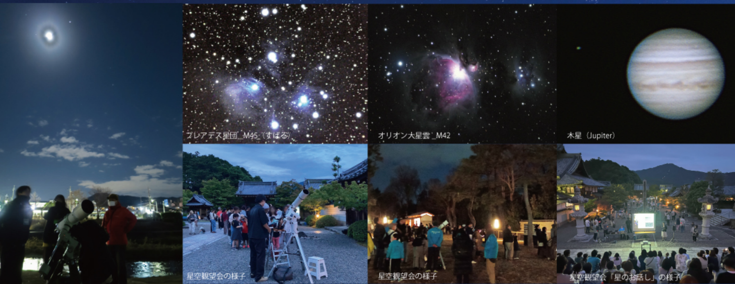
プレアデス星団 M45 (すばる)