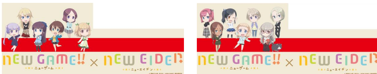
車体側面ラッピングのイメージ

※運転時間は日によって異なります。また、車両点検やその他の理由により運休や運行期間終了日を変更することがありますのであらかじめご了承ください。