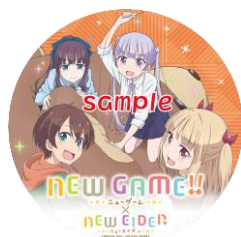
イベント限定仕様ヘッドマーク第5弾