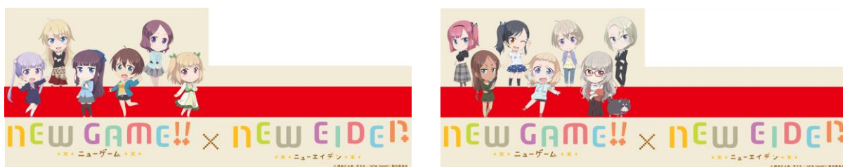
車体側面ラッピングのイメージ

※運転時間は日によって異なります。また、車両点検やその他の理由により運休や運行期間終了日を変更することがありますのであらかじめご了承ください。