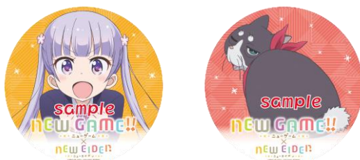
ヘッドマーク第4弾