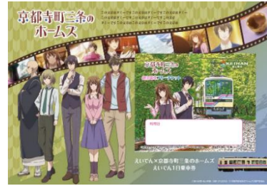
京都寺町三条のホームズ 叡山電車フリーチケット