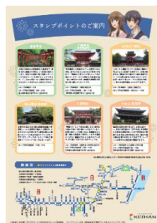
キャラクターパネル