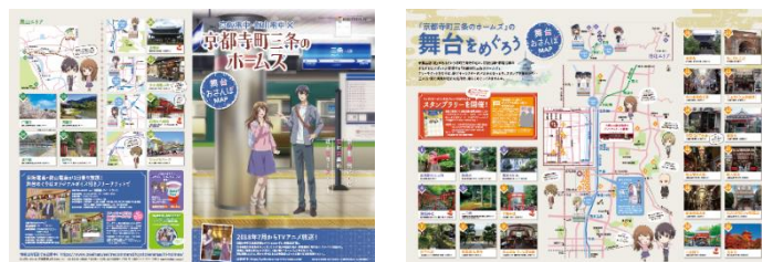
京阪電車・叡山電車×京都寺町三条のホームズ 舞台おさんぽマップ

URL: https://www.okeihan.net/recommend/kyototeramachi-holmes/