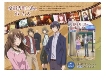
京都寺町三条のホームズ 京阪線フリーチケット

【発売場所】 京阪電車 中之島、淀屋橋、天満橋、京橋、守口市、寝屋川市、香里園、枚方市、樟葉、丹波橋、祇園四条、三条、出町柳の各駅 ※中書島駅では発売しませんのでご注意ください ※一部旅行会社等でも販売します