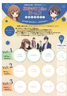
スタンプラリーシート