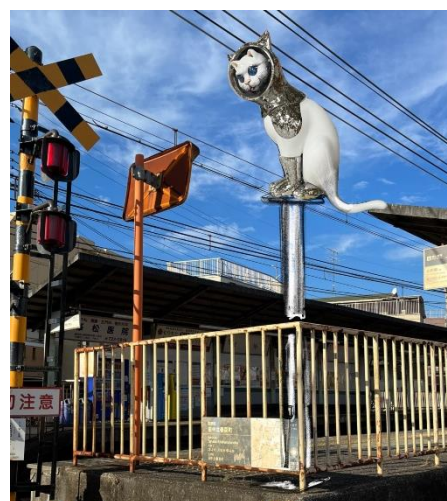
アーティスト作品の展示イメージ

また、『プラットホームギャラリー』として茶山・京都芸術大学駅（現・茶山駅 ※4/1より変更）にアーティスト作品の展示をスタートし、秋には開業時（1925年）から使用してきた駅施設のバリアフリー対応とともにリニューアルいたします。