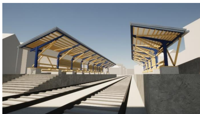
リニューアルイメージ