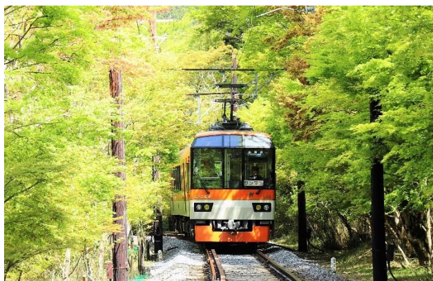
新緑のもみじのトンネルを走る展望列車「きらら」