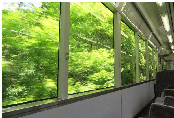
「もみじのトンネル」車窓からの風景