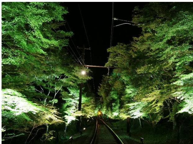
もみじのトンネル車窓