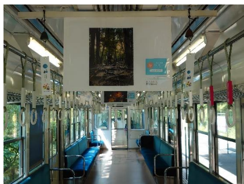
「悠久の風」号車内（展示イメージ）