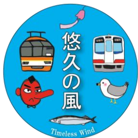
ヘッドマークデザイン