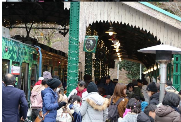
過去の開催時のようす