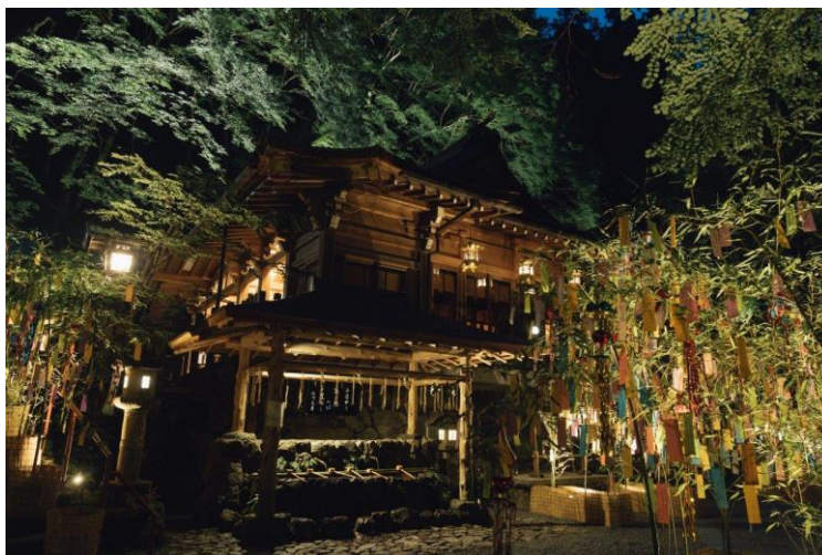
過去開催時の様子