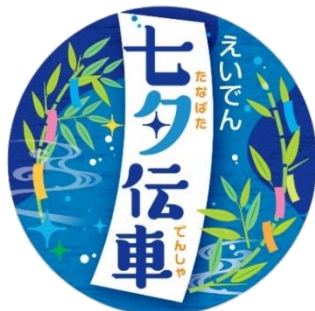
七夕伝車ヘッドマーク

※「七夕伝車」の運転時間は日によって異なります。また、車両点検やその他の理由により運休や運転区間の変更などがありますのでご了承ください。