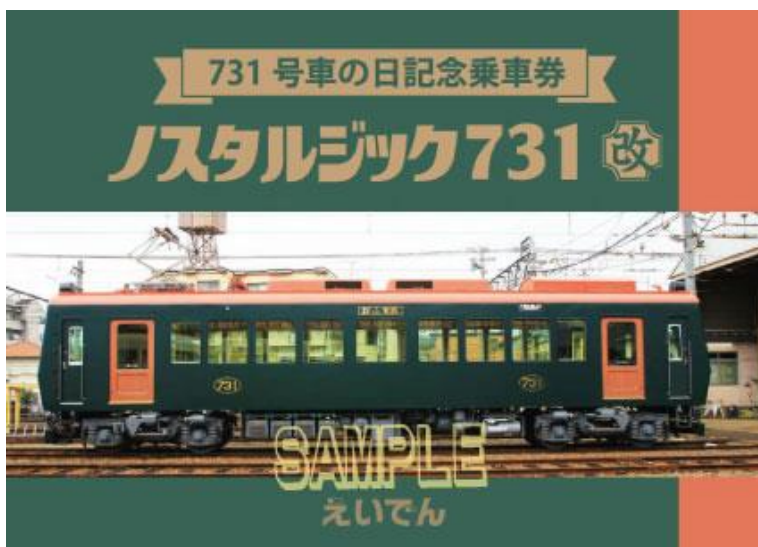
「731号車の日記念乗車券」の表紙デザイン