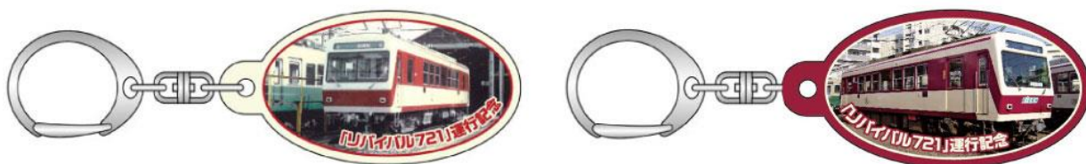
アクリルキーホルダーのイメージ