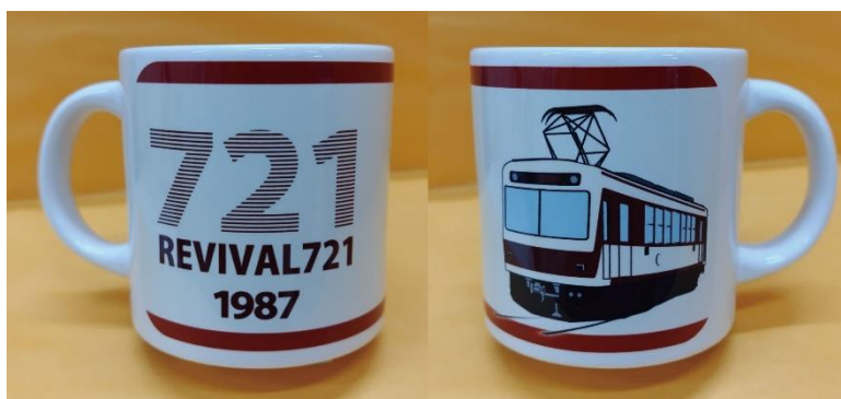
マグカップのイメージ