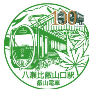
開業100周年記念デザインの例