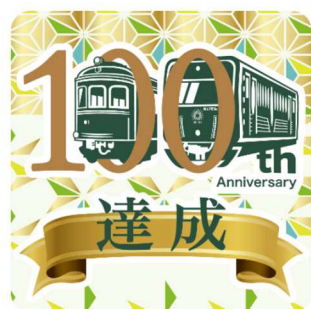
4駅達成オリジナルスタンプ